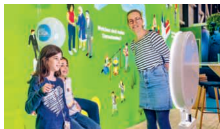
Ein Selfie von der LUGA: die Fotobox am Kirchenstand 2024.

Mit der Fotobox können sich alle vor einem selbst gewählten Hintergrund fotografieren lassen. Das Bild gibt's ausgedruckt als Erinnerung und/oder direkt