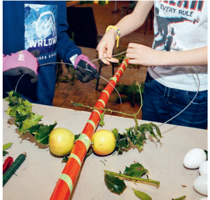
Kinder und Jugendliche binden Palmbäume.