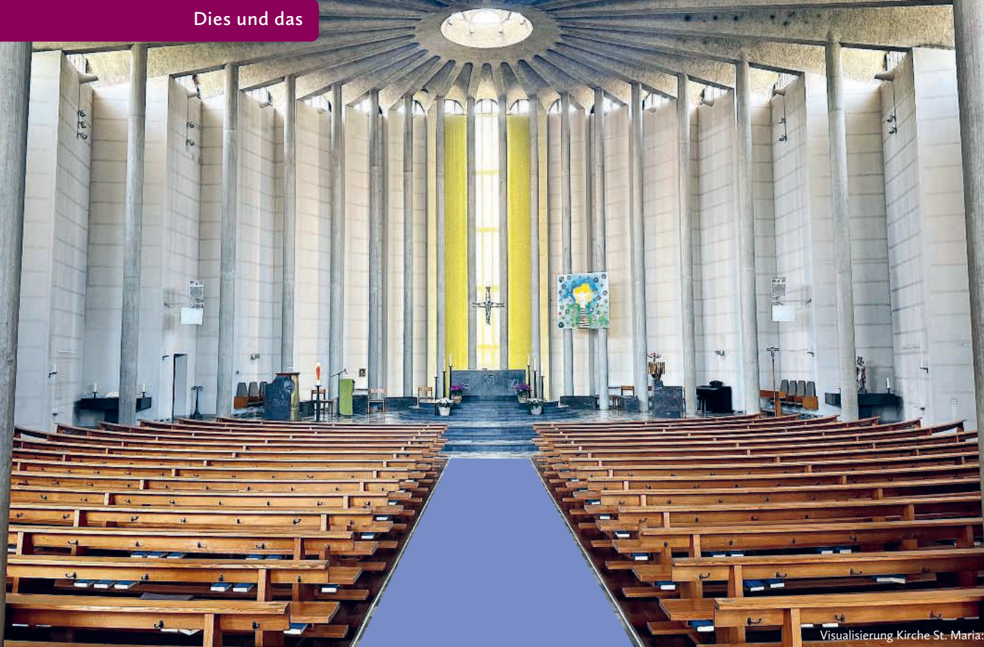
Visualisierung Kirche St. Maria: A. Scherz