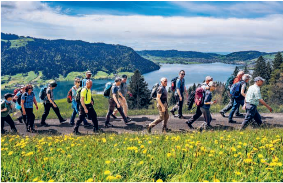
Mit Blick auf den Ägerisee: auf der Fusswallfahrt 2024.

Sa, 3.5. Fuss- und Velowallfahrt; So, 4.5. offizieller Wallfahrtstag | lukath.ch/wallfahrt