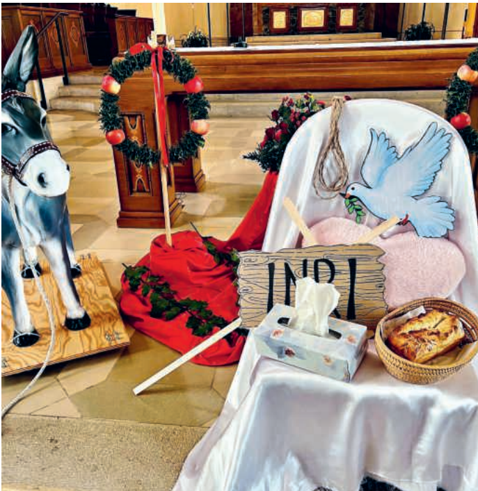
Schülerinnen und Schüler gestalten den Familiengottesdienst in Gerliswil mit.